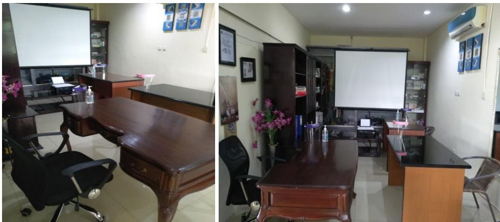
Gambar 1. Lokasi Kerja PT. Budi Andhika Prima Ayudia

PT. Budi Andhika Prima Ayudia (PT. BAPA) merupakan salah satu UMKM yang bergerak di bidang penjualan produk kosmetika perawatan tubuh yang baru berdiri di akhir tahun 2017. Meskipun sebagai bentuk usaha perseroan terbatas baru berusia 3 tahun, namun PT. BAPA sebenarnya adalah pemekaran dari PD. Budi Andhika (PD. BA) yang memisahkan antara fungsi manufaktur dan fungsi penjualannya. Gambar 1 menunjukkan foto lokasi kerja PT. BAPA