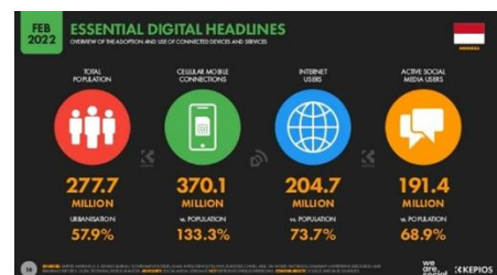
Gambar 1. Penggunaan Internet 2022

Pada era globalisasi saat ini, teknologi telah berkembang dengan sangat pesat. Teknologi diciptakan bertujuan untuk mempermudah dalam berkomunikasi serta mendapatkan informasi dengan cepat. Salah satu bukti dari perkembangan teknologi saat ini adalah internet. Internet biasanya digunakan untuk mencari informasi dan sebagai wadah untuk berkomunikasi. Selain untuk berkomunikasi, penggunaan internet juga digunakan mengakses media online. Media online yang paling sering digunakan yaitu media sosial.