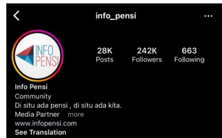
Gambar 2. Profil Akun Instagram @info_pensi

covid-19 berlalu acara pentas seni musik kembali diperbolehkan dan sangat menarik perhatian banyak orang. Banyak orang yang mencari informasi melalui media sosial terkait dengan pelaksanaan acara pentas seni musik yang akan diselenggarakan. Salah satu akun instagram yang menyebarkan informasi seputar acara pentas seni musik yaitu @info_pensi. Akun @info_pensi memanfaatkan media sosial instagram untuk memenuhi kebutuhan informasi followers yang mencari informasi terkait dengan acara pentas seni yang akan diselenggarakan di Jabodetabek.